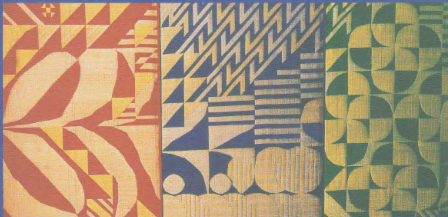
Foto yang tertera di dalam laporan ini berlatarbelakangkan paparan tenunan kain songket yang menghiasi dinding Aras 29, Ibu Pejabat Bank Muamalat.

(disempurnakan pada / completed in 1973)